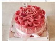
ギフトにおすすめ！ お肉ケーキ