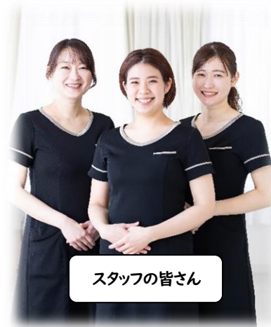
スタッフの皆さん