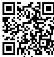
↑↑ お店の ホームページ